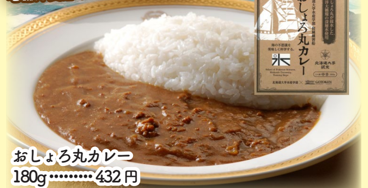
おしよろ丸カレー 180g..... 432円