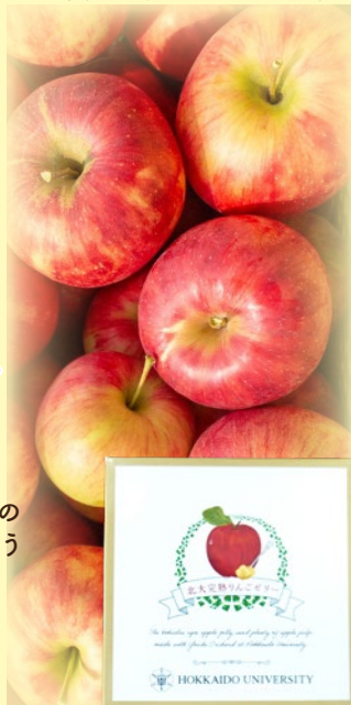
北大完熟りんごゼリー 75g..... 331円

暖かな気候で知られている北海道余市町。北海道大学 北方生物圏フィールド科学センター余市果樹園は1912年の設立当時から北海道の気候風土に合う果物の研究を続けています。