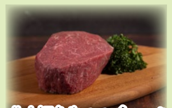
北大短角牛モモブロック 300g.....2,376円